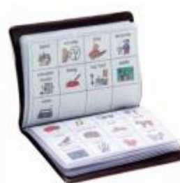
Livro de comunicação