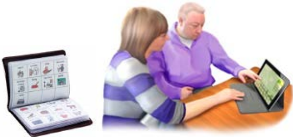
Alternativ og støttende kommunikation

Ingen med afasi bør udskrives fra hospitalet uden mulighed for at kunne kommunikere sine behov og ønsker eller uden en dokumenteret plan for, hvordan og hvornår dette kan opnås.