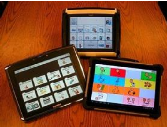
Alternatif ve destekleyici iletişim cihazı