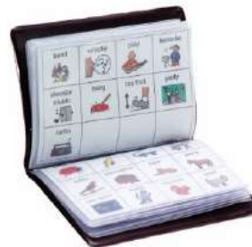
Libro de comunicación